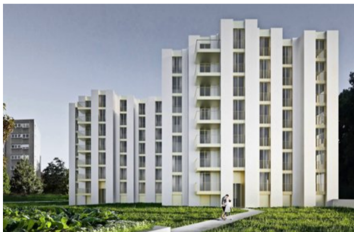
Le projet du bureau d'architectes FHV prévoit 60 logements en loyers contrôlés. Un détail qui a son importance.

Au milieu du quartier de la Casbah, bâti dans les années septante, réside un espace encore vierge de construction. Aux Boveresses, le terrain dit des «P'tits cailloux» est la dalle qui couvre un parking souterrain. Propriété de la Ville de Lausanne, celui-ci a été mis à disposition d'une coopérative de logements afin de valoriser ce terrain.