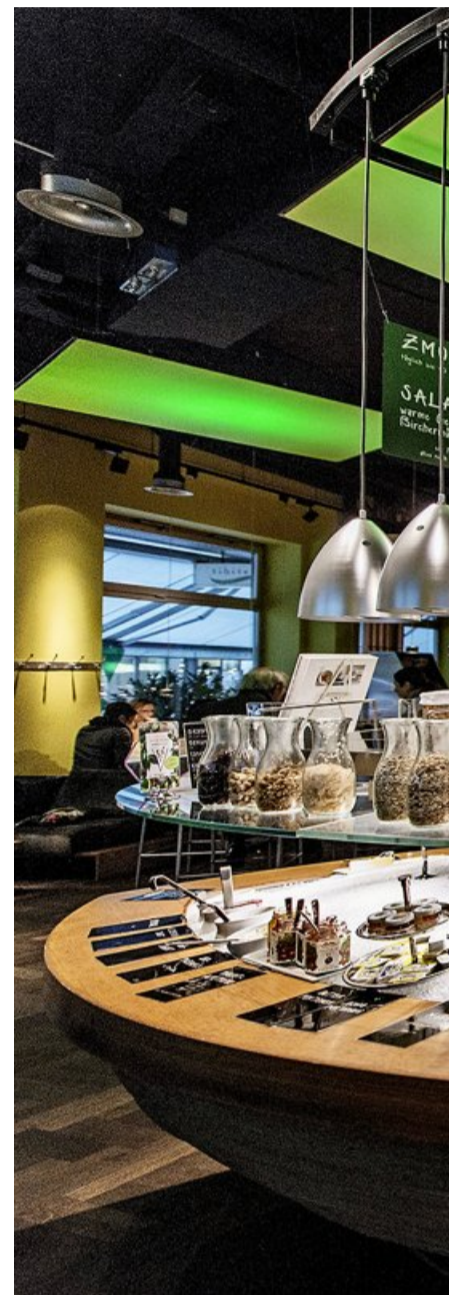
Le restaurant Tibits de Zurich. Créé

Pour rappel, le Buffet de la Gare et les salles de réunion situées au-dessus ont fait l'objet, en