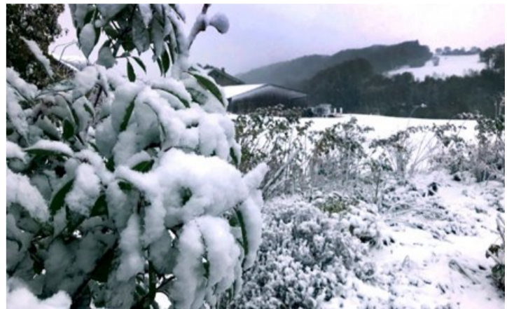
La neige a fait son retour dans de nombreuses communes du canton, comme ici à Dommartin. SÉBASTIEN FÉVAL